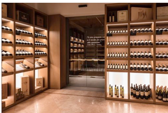
restyling cantina e punto vendita Cesari, Cavaion Veronese 2017