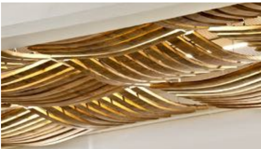
progettazione di riqualificazione cantina Bertani, (Tenimenti Angelini) Grezzana, Verona, 2013