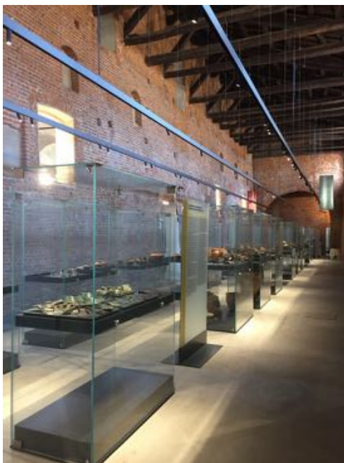
coll. allestimento museo archeologico di Vigevano 2018 Alessandro Colombo architetto