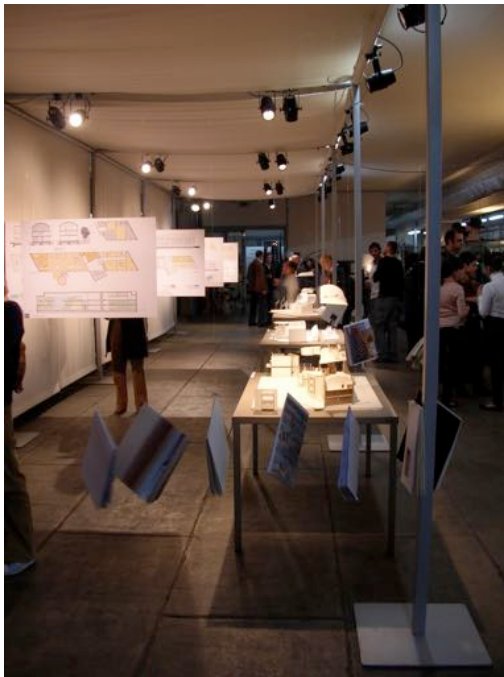
allestimento mostra didattica "Exhibition: Design Factory", Blitz, Milano 2007