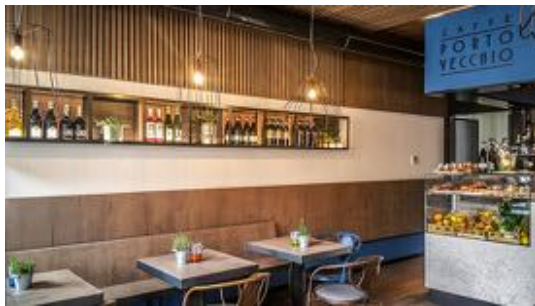
"Caffè Porto Vecchio", Lazise, Verona, giugno 2016