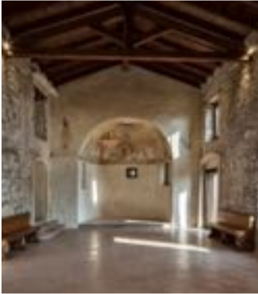
progetto di ristrutturazione ex chiesetta Ognisanti, 2016-2017, Tenuta Novare, Verona (Bertani Domains- tenimenti Angelini)