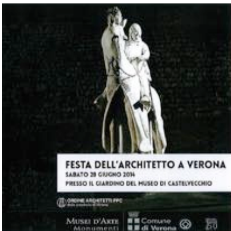
convegno: Parole chiave sui lavori di Carlo Scarpa , Museo di Castelvecchio, 2014

di architettura e pianificazione, Dipartimento Indaco. Milano, 14.02.2006