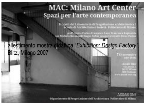
allestimento mostra didattica "Exhibition: Design Factory", Blitz, Milano 2007