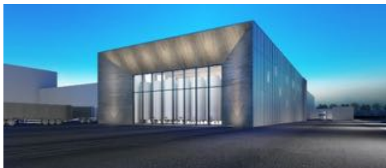
progetto preliminare per ampliamento in cantina Caviro, Forlì