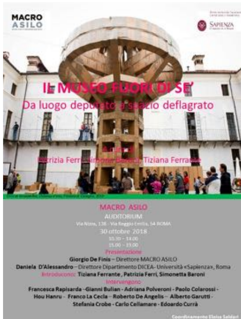
convegno: Il museo "fuori di sé". Nuove spazialità dell'espore museografico , MACRO Roma, 2018

Il museo "fuori di sé". Nuove spazialità dell'espore museografico , convegno tenuto presso il MACRO museo arte contemporanea Roma, 30 ottobre 2018