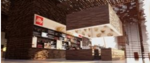
EXPO 2015 - Cluster "Caffè" (con arch. Alessandro Colombo)