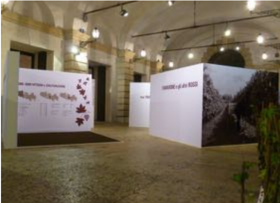
allestimento evento "Anteprima Amarone" Palazzo Gran Guardia, Verona gennaio -2016