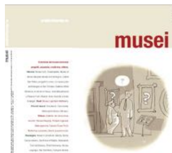
alcune copertine di riviste - pubblicazioni