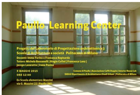
allestimento mostra didattica "Paullo Learning Center", Paullo 2015