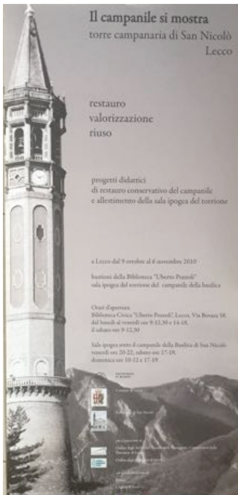
"Il campanile si mostra Torre campanaria di San Nicolò Lecco, restauro, valorizzazione, riuso", esposizione dei lavori degli studenti del Lab. di restauro -Architettura degli Interni e Allestimento, Lecco 2010