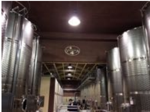
progetto di sistemazione cantina Val di Suga a Montalcino, 2013-2014 (Tenimenti Angelini)