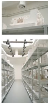
esposizione dei modelli degli studenti presso al Biennale di Architettura 2012, lavori degli studenti del lab. di progettazione architettonica III, prof. Imma Forino, prof. Francesca Lanz, prof. Francesca Rapisarda,

Politecnico di Milano. Facoltà di Design Prof. Luca Basso Peressut A.A. 2003/2004 A.A. 2004/2005 A.A. 2006/2007