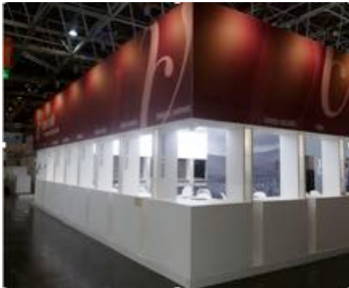
Stand Consorzio tutela Vini Valpolicella Vinitaly, Verona, Prowein, Dusseldorf, 2013 - 2014