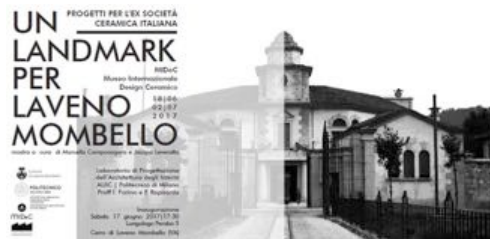
allestimento mostra didattica "Fabbrica ceramiche Ponti a Laveno Mombello", Laveno, Lecco, 2017