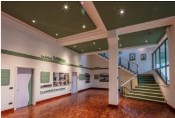
ristrutturazione cantina, realizzazione di spazio espositivo Cantina Fazi Battaglia, Castelplanio, Ancona, 2018

- Interviste ai sigg.ri Ottolenghi e Allegrini, in Giuseppe Tommasi, I disegni di Carlo Scarpa per casa Ottolenghi , a cura di Alba di Lieto, Silvana Editore 2012, pp. 230-235