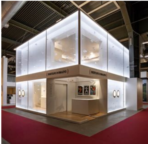
Stand Bertani Domains, Vinitaly Verona 2018- 2019

progetto di sistemazione cantina Val di Suga a Montalcino , 2013-2014