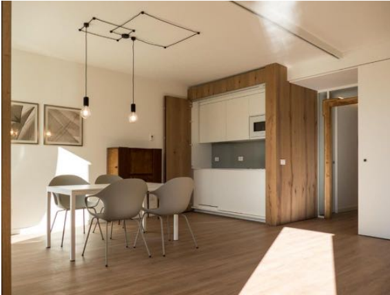
ristrutturazione appartamento privato presso Porto Vecchio, Lazise, Verona, 2017