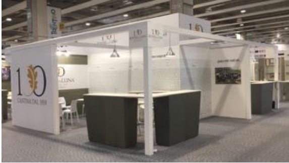
Stand Cantina Roverè della Luna, Trento, Vinitaly Verona 2019