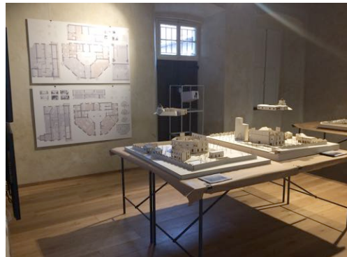
allestimento mostra didattica "Fabbrica ceramiche Ponti a Laveno Mombello", Laveno, Lecco, 2017