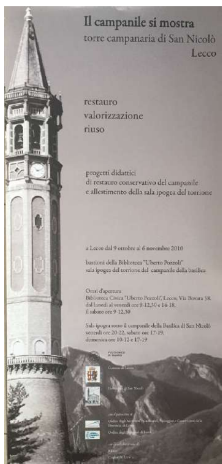
"Il campanile si mostra Torre campanaria di San Niccolò Lecco, restauro, valorizzazione, riuso", Lecco 2010

- Collaborazione nella fase di allestimento della mostra didattica, Orientamento Interni, Politecnico di Milano, Spazio Mostre, Via Bonardi 3, 22 settembre 2008 - 1 ottobre 2008