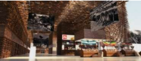
EXPO 2015 - Cluster "Caffè" (con arch. Alessandro Colombo)