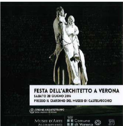
convegno: Parole chiave sui lavori di Carlo Scarpa , Museo di Castelvecchio, 2014