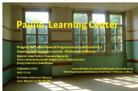
Allestimento mostra didattica "Paullo Learning Center", Paullo 2015