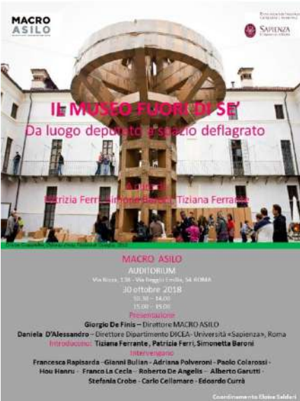
convegno: Il museo "fuori di sé". Nuove spazialità dell'espore museografico , MACRO Roma, 2018