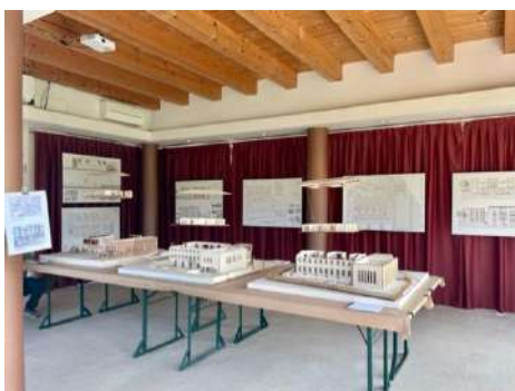
allestimento mostra didattica Vivere Insieme", Progetti di inclusività sociale per la scuola elementare di Affi, 2022