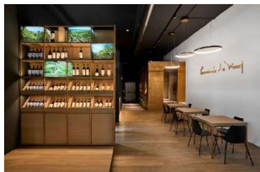
Allestimento mostra "Leonardo il dono della Vigna", Vinci, 28.06.22