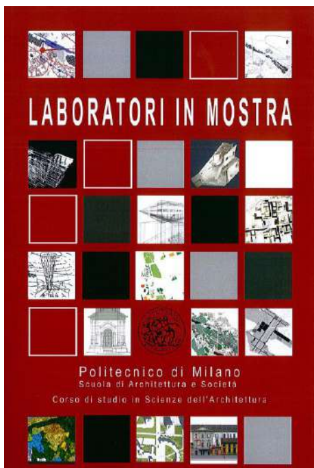
Laboratori in mostra