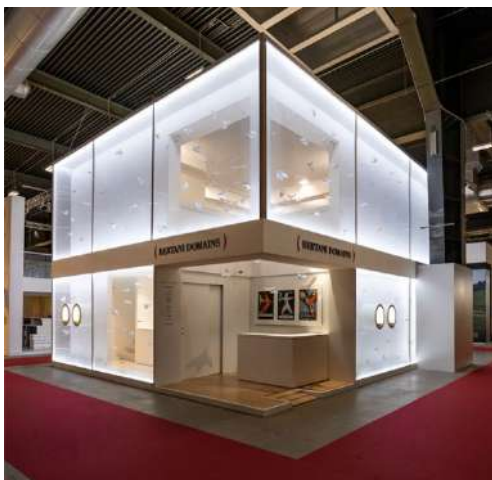
Stand Bertani Domanis, Vinitaly Verona 2018- 2019