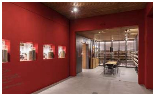
restyling cantina e punto vendita Cesari, Cavaion Veronese 2017