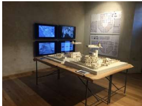
Allestimento mostra didattica "Fabbrica ceramiche Ponti a Laveno Mombello", Laveno, Lecco, 2017