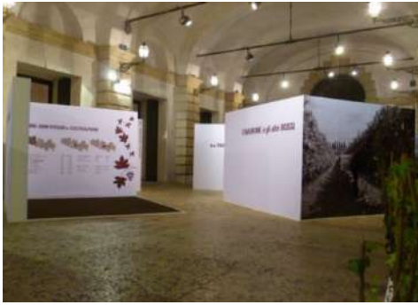
allestimento evento "Anteprima Amarone" Palazzo Gran Guardia, Verona gennaio -2016