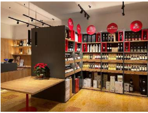
Wine shop Giv Patrengo, Verona 2022