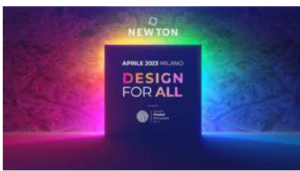
Talk: Design for All , Superstudiodesign show, fuorisalone Milano 2023