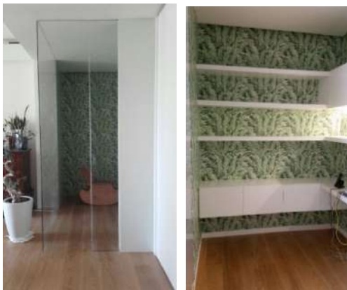
ristrutturazione appartamento privato, Via Ceriotto, Verona 2017