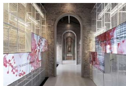
Coll. al progetto di Migliore+Srervetto per l'allestimento presso le Procuratie Vecchie, Piazza San Marco, 2022