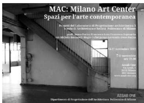
Allestimento mostra didattica "Milano Art Center. Spazi per l'arte contemporanea", Assab One, Milano 2012