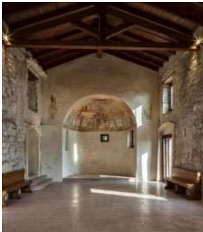
progetto di ristrutturazione ex chiesetta Ognisanti, 2016-2017, Tenuta Novare, Verona (Bertani Domains-tenimenti Angelini)