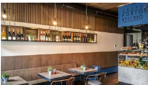
progettazione di un bar "Caffè Porto Vecchio", Lazise, Verona giugno 2016