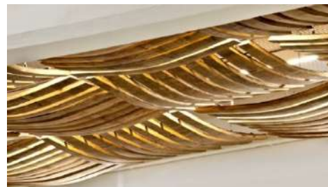
progettazione di riqualificazione cantina Bertani, (Tenimenti Angelini) Grezzana, Verona, 2013