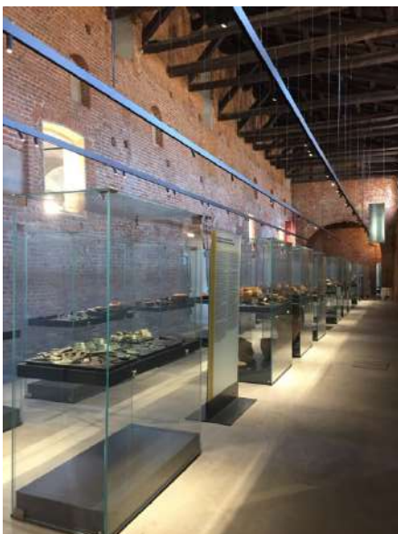
coll. allestimento museo archeologico di Vigevano 2018 Alessandro Colombo architetto