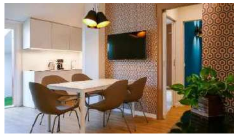
Ristrutturazione appartamenti privati Lazise, 2017 e 2020/21