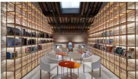
Coll. al progetto di Migliore+Srervetto per l'allestimento presso le Procuratie Vecchie, Piazza San Marco, 2022