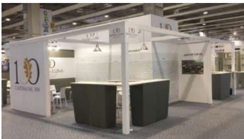
Stand Cantina Roverè della Luna, Trento, Vinitaly Verona 2019