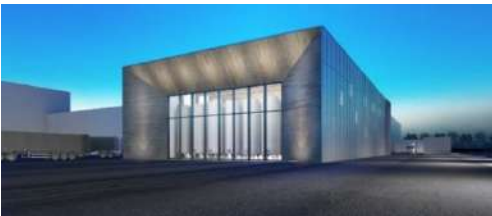
progetto preliminare per ampliamento in cantina Caviro, Forlì