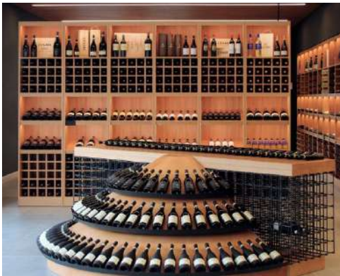
allestimento, Punto Vendita Cesari Fumane, 2021

- Da settembre 2010 a luglio 2011 collaborazione con il museo di Castelvecchio , Verona, ed in particolare progettazione per: