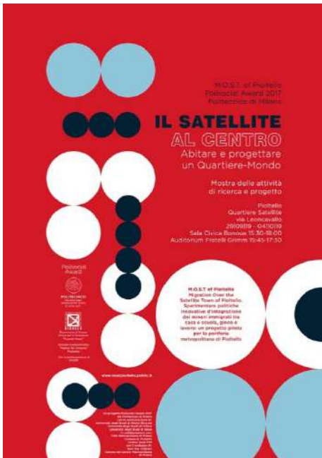
allestimento mostra didattica "Il Satellite al centro. Abitare e progettare un Quartiere-Mondo", 2019