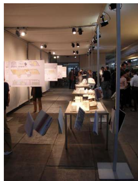
Allestimento mostra didattica "Exhibition: Design Factory", Blitz, Milano 2007