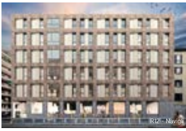
R12 - Navigli