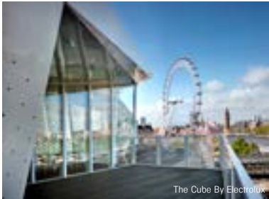
The Cube By Electrolux