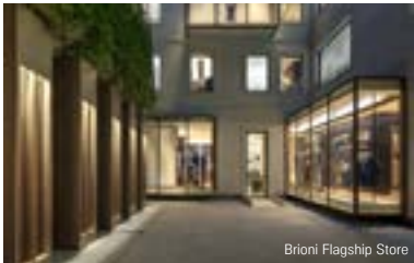
Brioni Flagship Store