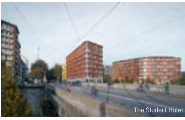
The Student Hotel