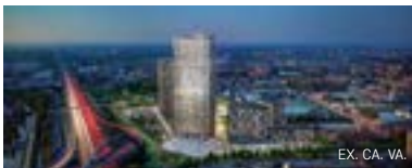
EX. CA. VA.