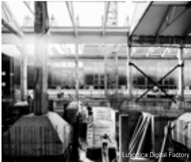
Luxottica Digital Factory