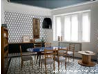
Appartamento Arco della Pace