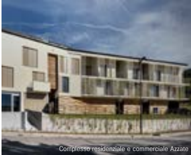
Complesso residenziale e commerciale Azzate