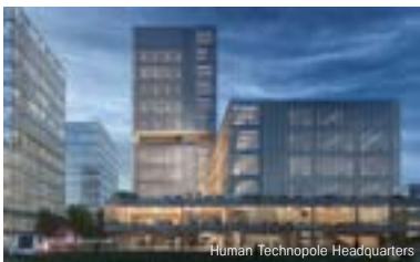
Human Technopole Headquarters