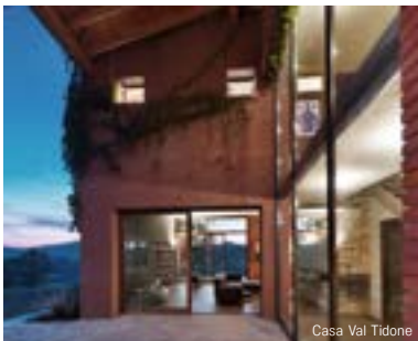
Casa Val Tidone