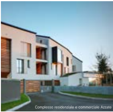
Complesso residenziale e commerciale Azzate