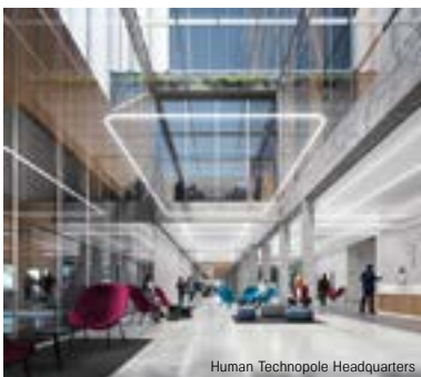
Human Technopole Headquarters