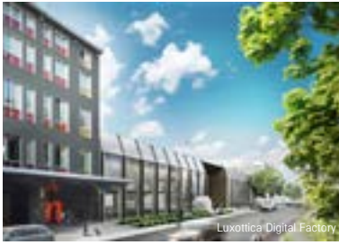
Luxottica Digital Factory