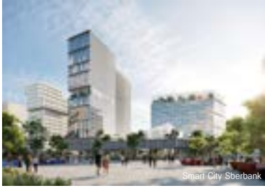
Smart City Sberbank