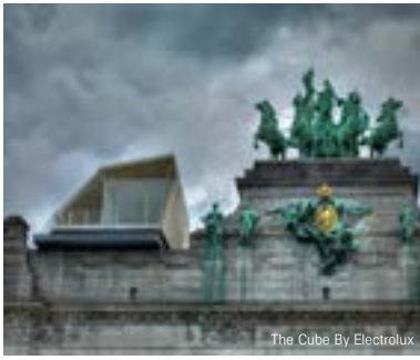
The Cube By Electrolux