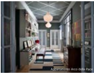
Appartamento Arco della Pace