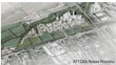
AT1 Città Nuova Rozzano