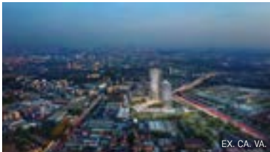
EX. CA. VA.