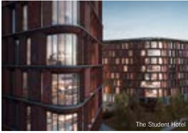
The Student Hotel