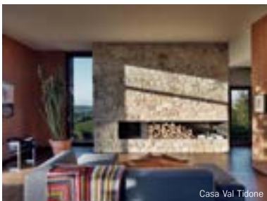
Casa Val Tidone