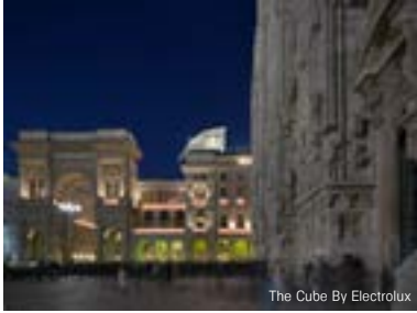
The Cube By Electrolux