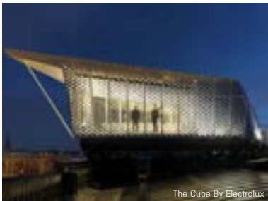
The Cube By Electrolux