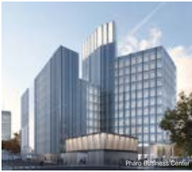
Pharo Business Center