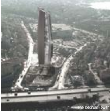
The Regnum Tower