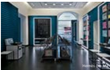
Hermès Silk Mix