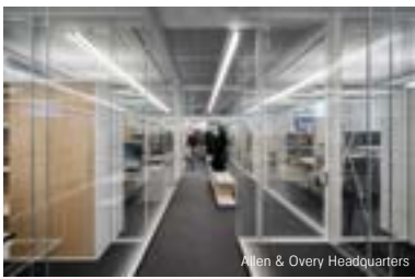
Allen & Overy Headquarters