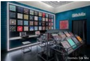
Hermès Silk Mix