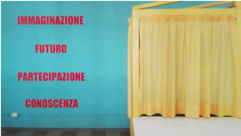
Nuovi_Caratteri Istituto Tecnico Economico Bodoni Parma 2017