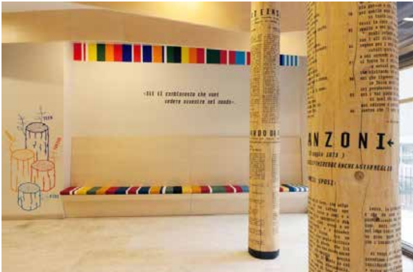
Teach_me Scuola Europa Milano 2010-2011