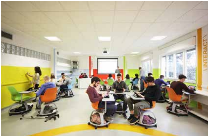
Future_Classroom Istituto d'Istruzione Secondaria Superiore Paciolo-D'Annunzio Fidenza (PR) 2015