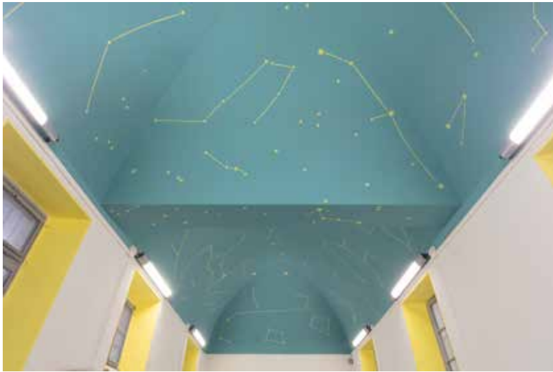
costellazioni Convitto Nazionale Carlo Alberto Novara 2019